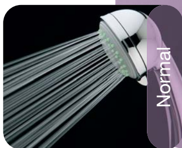
Drupy 3 getti 3 sprays