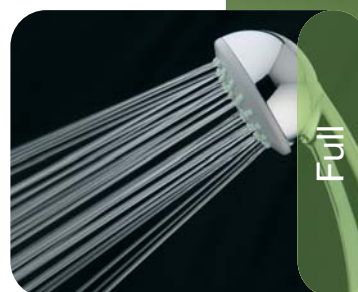
Drupy Full Spray