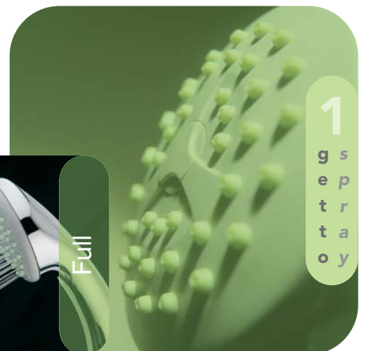
Linea Plus Full Spray