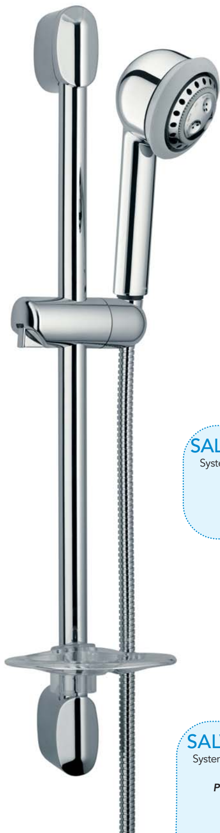
SALV62521VGCR Systema POLO PLUS - 025 Full Spray POLO PLUS - 025 Full Spray shower system