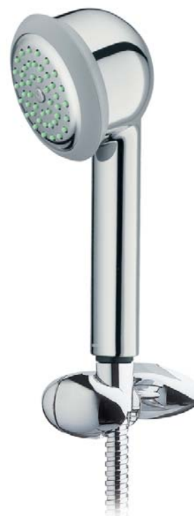
DPO21VGCR Doccia POLO PLUS Full Spray POLO PLUS Full Spray shower